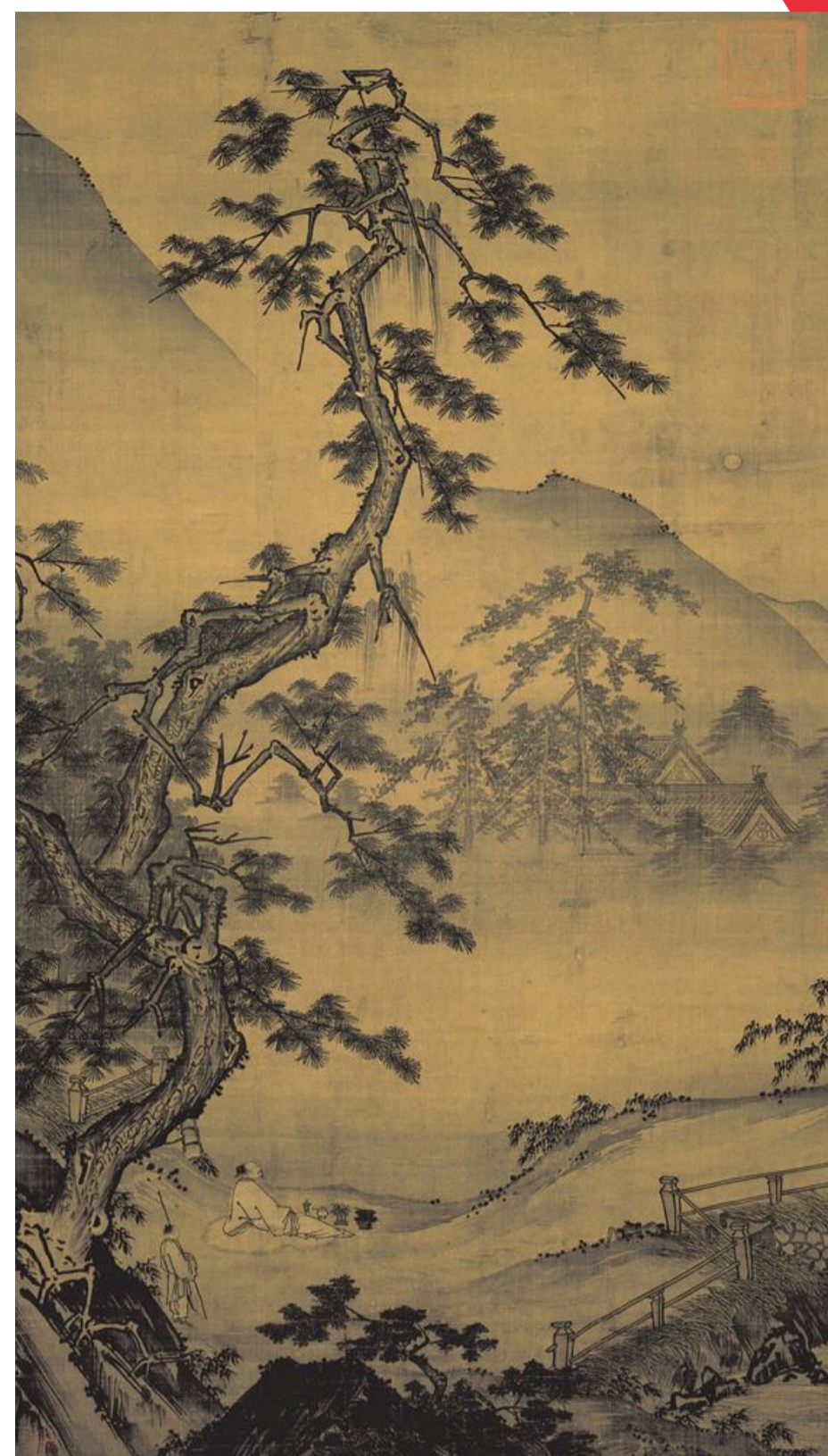
Ма Юань (1160-1225) Китайский художник эпохи Сун

Участники исследуют художественные традиции Китая, Японии и исламского мира: от туманной живописи суми-э и фарфоровой пластики до каллиграфии и архитектурных шедевров.