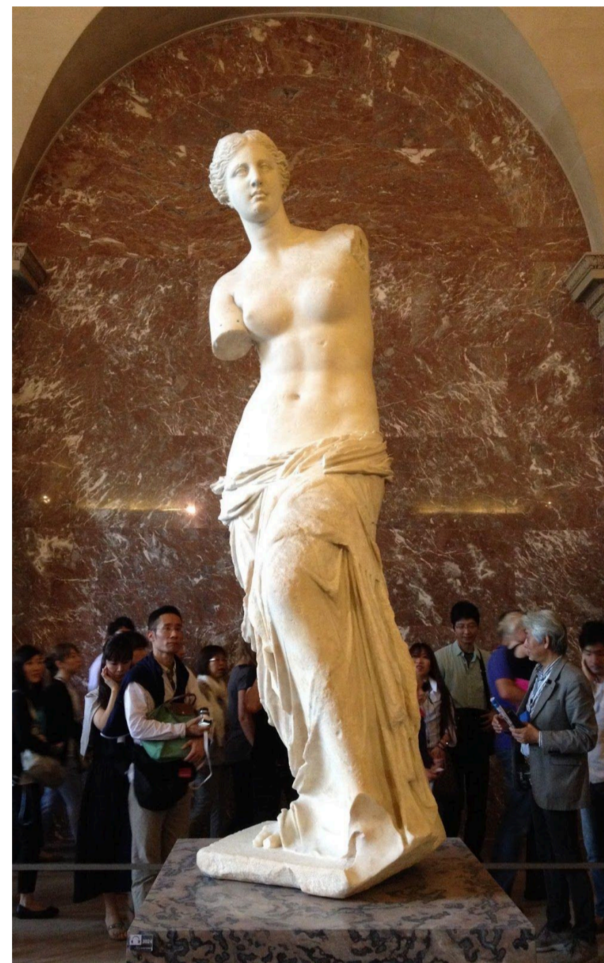
Венера Милосская, 130-100 лет до н.э.

Античное искусство — это язык, на котором говорила одна из величайших цивилизаций. Эта лекция приглашает участников исследовать его красоту, гармонию и мифологическую глубину.