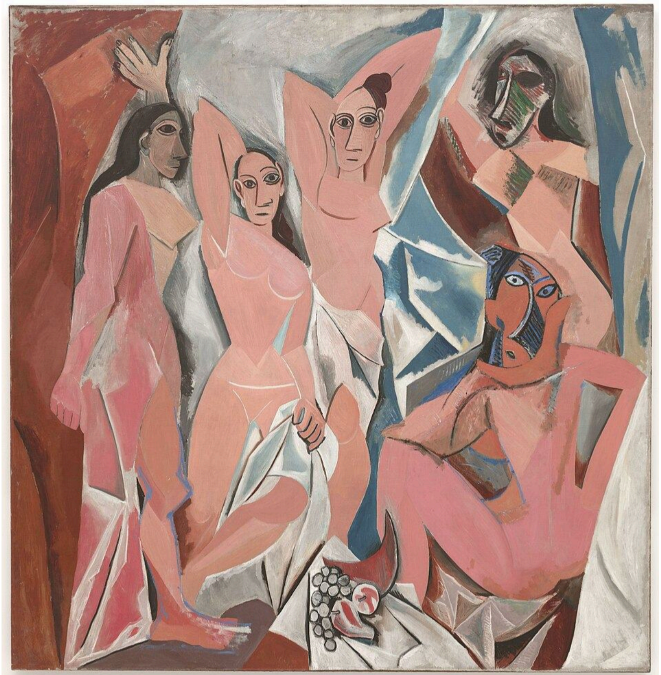
Пало Пикассо «Авиньонские девицы», 1907

Участники узнают, как художники искали новые формы выражения в кубизме, стремились к чистому переживанию в абстракции и передавали внутренние конфликты через экспрессию и иррациональные образы.