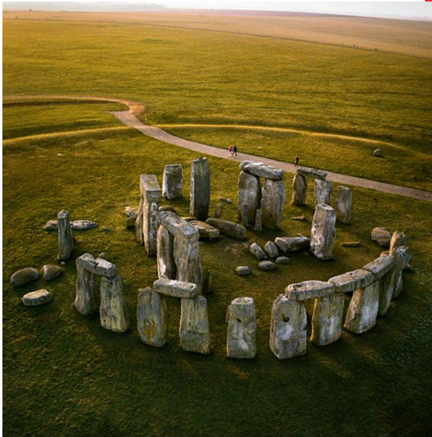
Стоунхендж, 1400 г до н.э. Великобритания,

На лекции «Искусство первобытного мира» участники отправятся в путешествие во времени — к первым изображениям, высеченным на стенах пещер, к загадочным мегалитам и миниатюрным статуэткам, передающим представления древнего человека о мире и себе.