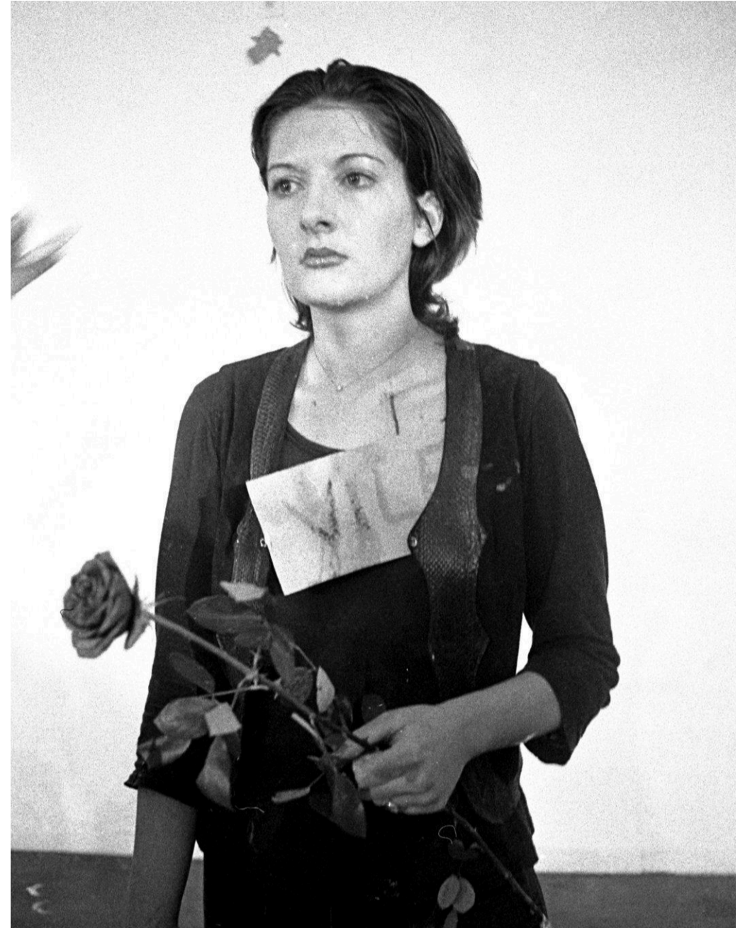
Марина Абрамович, перформанс «Ритм 0», 1974

Участники исследуют, как искусство выходит за пределы холста — в городскую среду, тело, цифровое пространство и научную лабораторию.