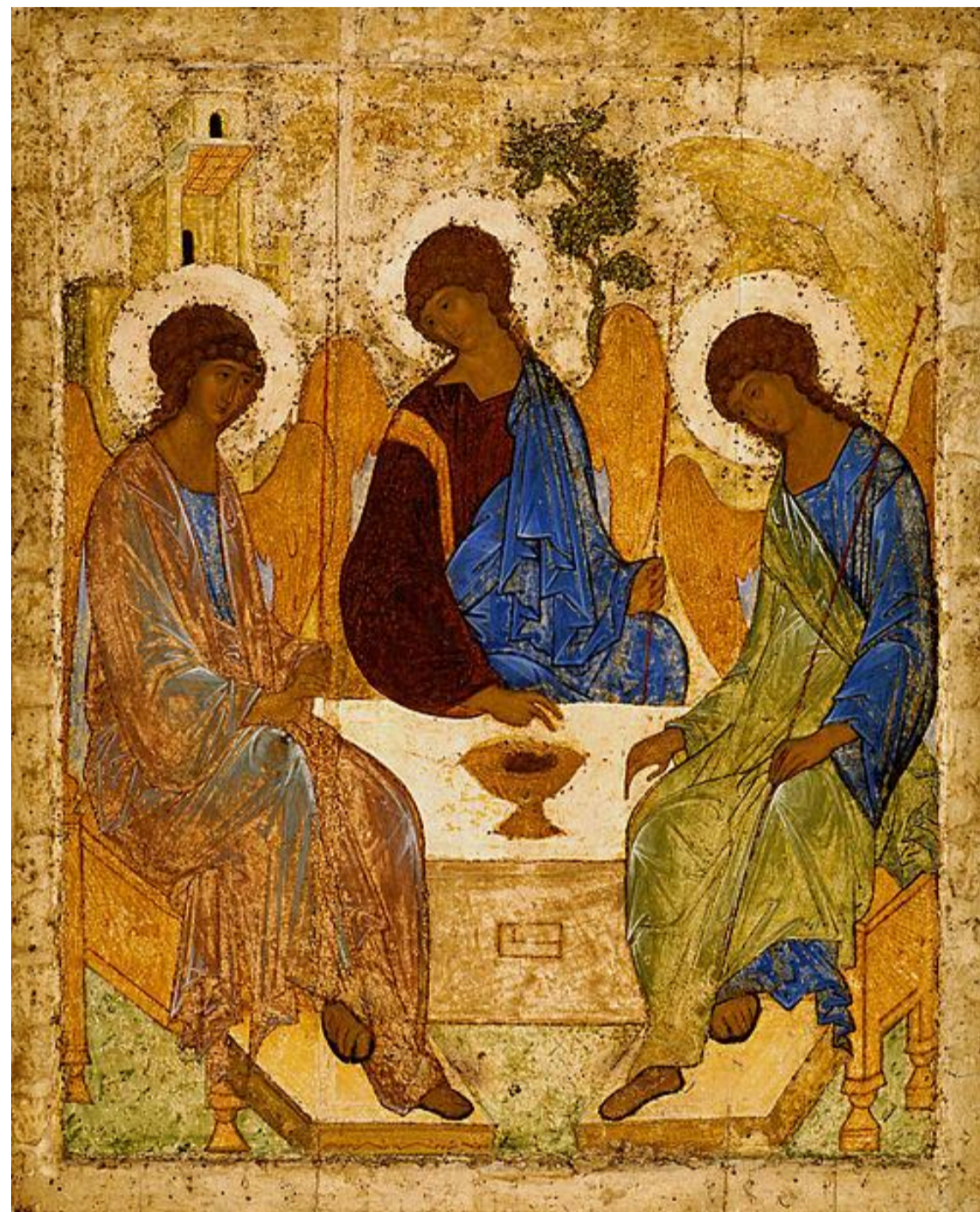
Андрей Рублев «Троица», 1425-1427

Русское искусство рассматривается как часть широкой культурной карты мира — в диалоге с европейскими традициями и в контексте глобальных художественных процессов.