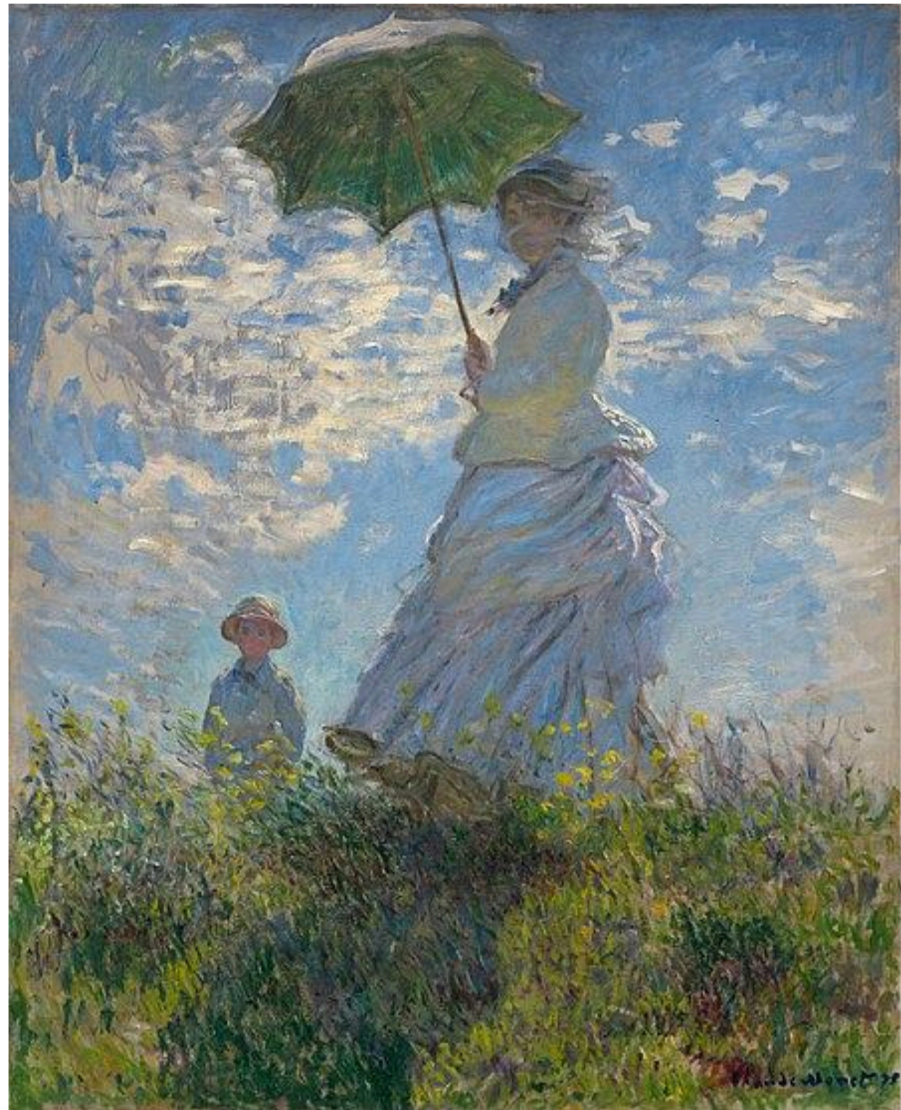
Клод Моне «Дама с зонтиком», 1875

Импрессионисты фиксируют мимолётные состояния природы и света, ищут движение и дыхание реальности в каждом мазке. Постимпрессионисты же идут дальше – разрушают форму, наполняют образ символами, усиливают выразительность цвета и линий.