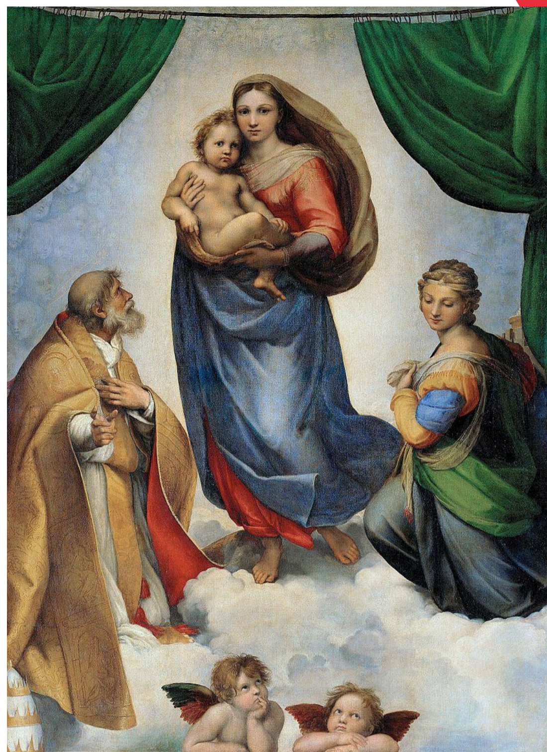
Рафаэль «Сикстинская Мадонна», 1512-1513

Участники узнают о предпосылках Ренессанса, его периодах и центрах развития, от первых шагов Джотто до триумфа Высокого Возрождения и изысканности маньеризма.