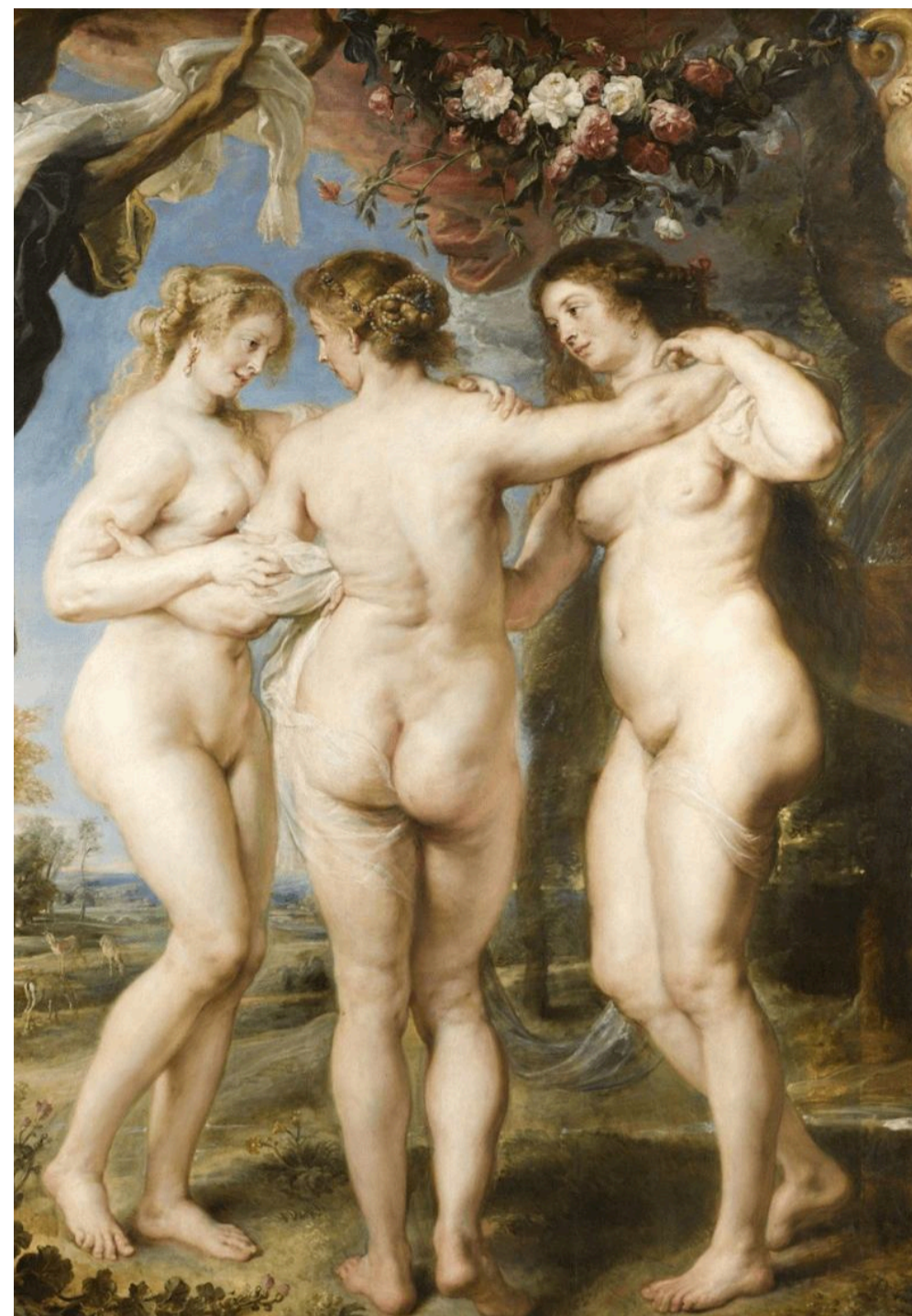
Питер Пауль Рубенс «Три Грации», 1630-1635

Эти стили не просто отражают эпоху – они создают выразительный язык, в котором соединились власть, религия, философия и образ человека.